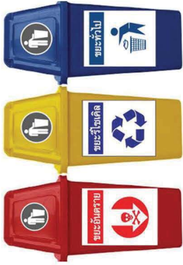
ตัวอย่างถังขยะแต่ละประเภท